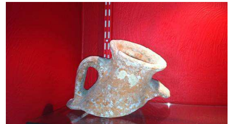
Vestige de l'époque romaine

A partir de l'existence des vestiges romains que nous côtoyons tous les jours à Biot : monument de la Chèvre d'Or, stèle d'Arbugio, aqueducs, pierres gravées en latin encore scellées dans les murs de nos chapelles et église, monnaies romaines, la ville a trouvé opportun de s'interroger sur l'histoire de ce patrimoine ancestral.